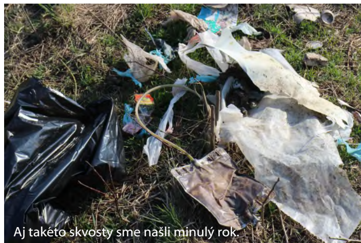
Aj takéto skvosty sme našli minulý rok.

Už šesťkrát sme sa pokúsili jarným upratovaním trochu skrášliť našu obec a jej okolie. Dá sa povedať, že sa nám to aj podarilo. Viackrát to bol Všivavec, okolie cesty na priehradu, cesta do hájička, alebo cesta na „staré kúpalisko“, ale aj uličky obce. Prečo viackrát? Lebo po roku sú, žiaľ, odpadky opäť na mieste činu a i keď je ich menej, na obaly od keksíkov, plastové fľaše, ale aj iný - horší bordel v prírode či v mieste, kde žijeme,