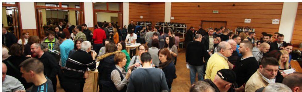
27. ročník Ochutnávky vín Horné Orešany 2016 Na strane 1