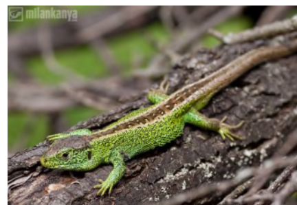
Plazov sa netreba báť Na strane 4