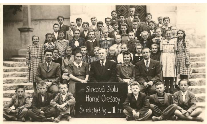
Stredná škola Horné Orešany, 1948 - 49