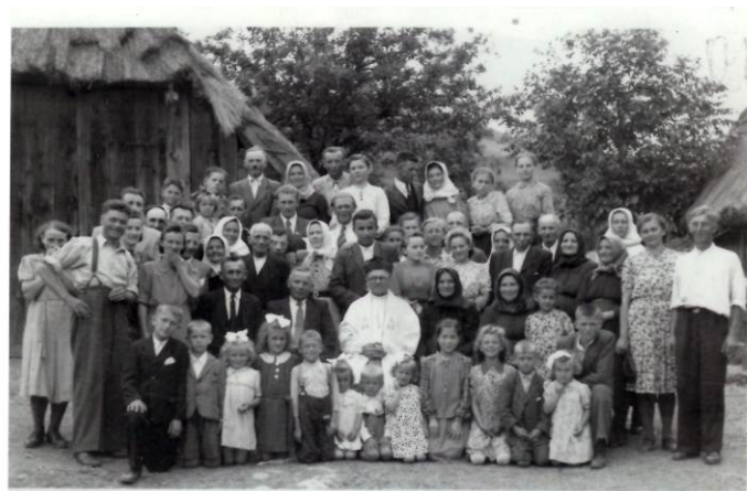
Primície Rudolf Benovič, rok 1944-45