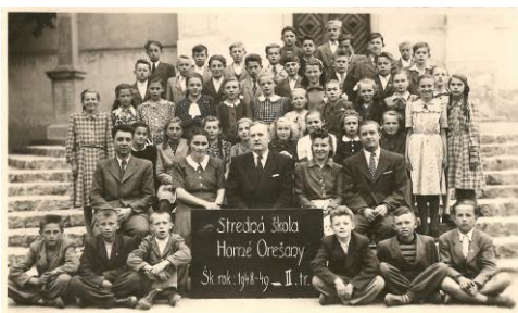
Archívne fotografia Na strane 3