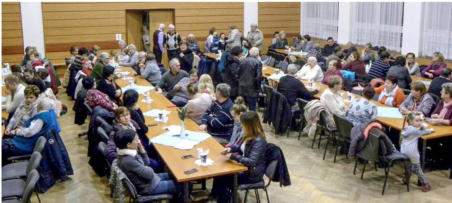
Vianočná kapustnica v kultúrnom dome