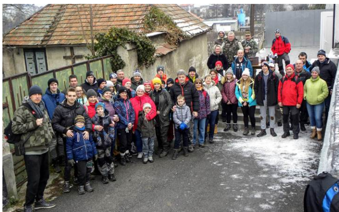
Stretnutie pred výstupom na Slepý vrch 30.12.2017