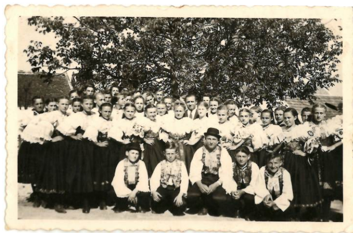
Hornoorešanský spevokol