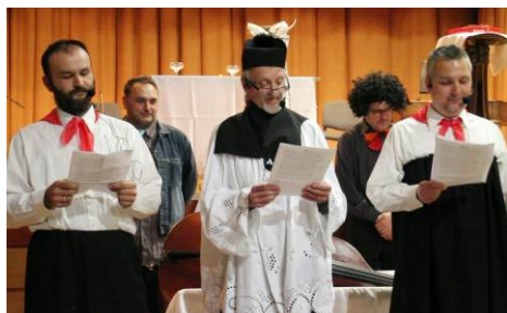
Pochovali sme Fidlibasu Na strane 2