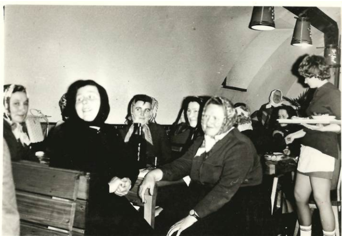
Posedenie k MDŽ vo vinnári z JRD

Prosíme občanov, ktorí majú doma staré fotografie z obce, aby sa o ne podelili aj s ostatnými, radi by sme z nich urobili fotokópie pre ďalšie generácie. Všetky naskenované fotografie budú umiestnené na webe obce.