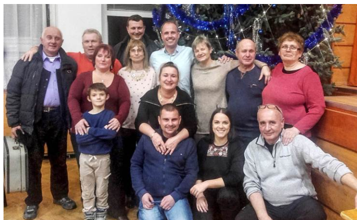
Vianočná kapustnica v kultúrnom dome