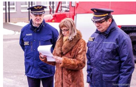
Zrekonštruovaná Tatra pre našich hasičov Na strane 3