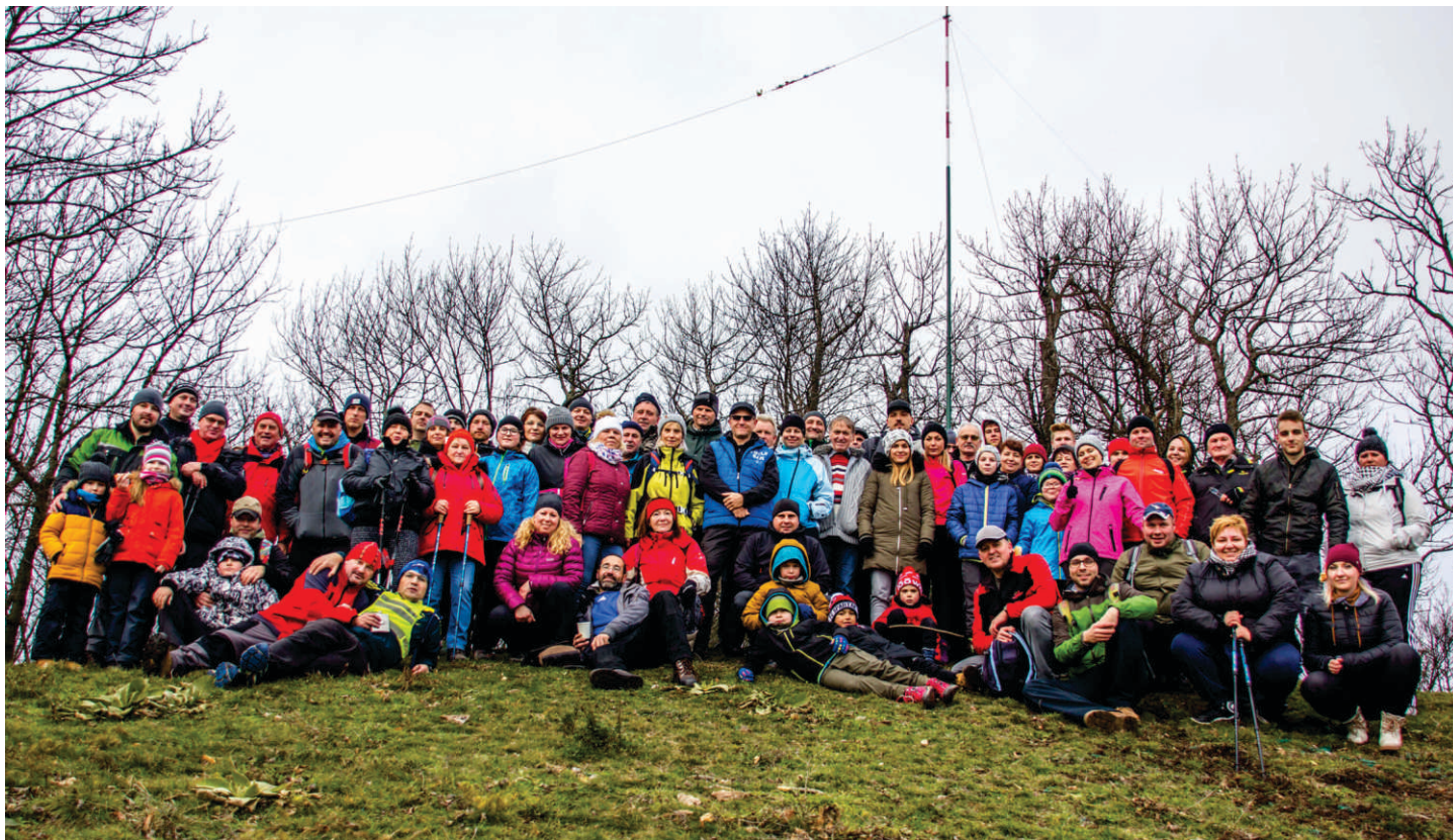
Vystup na slepy vrch 29.12.2018