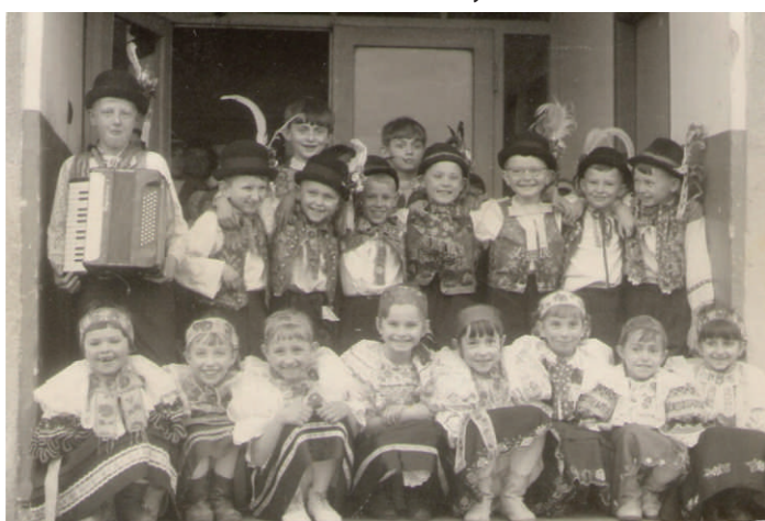
1967 z oslavy MDŽ