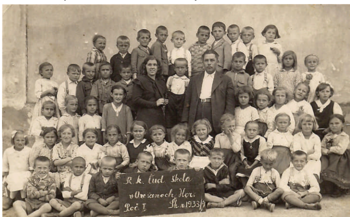
Šk. rok 1933-34, archív Ľubomír Šajbidor