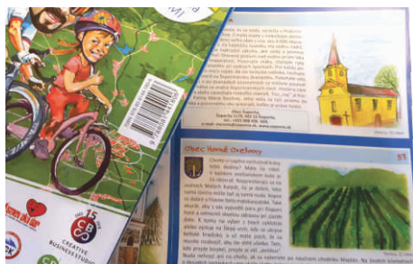
Školský rok 2018 /2019 str. 3