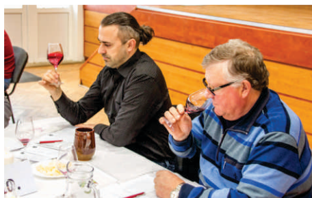
Orešanská košťofka str. 4