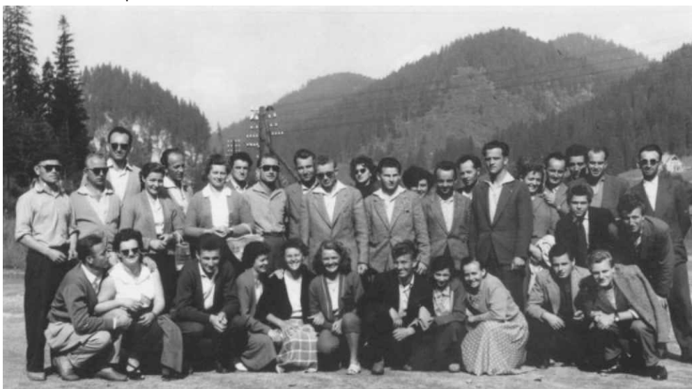
Hornorešanskí športovci, r. 1958