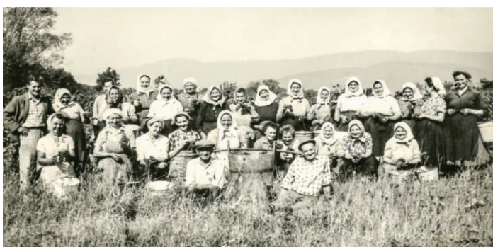
* oprava z čísla 3/2018: fotografia „Spoločná obaračka 1961“