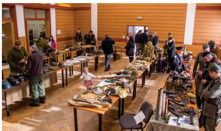
Výstava SNP, KD H. Orešany