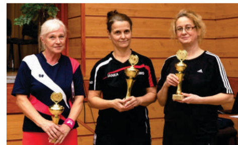
Betonári str. 11