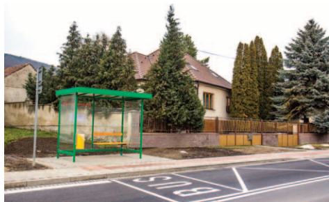
Rekonštrukcia zastávky na Dolnom konci