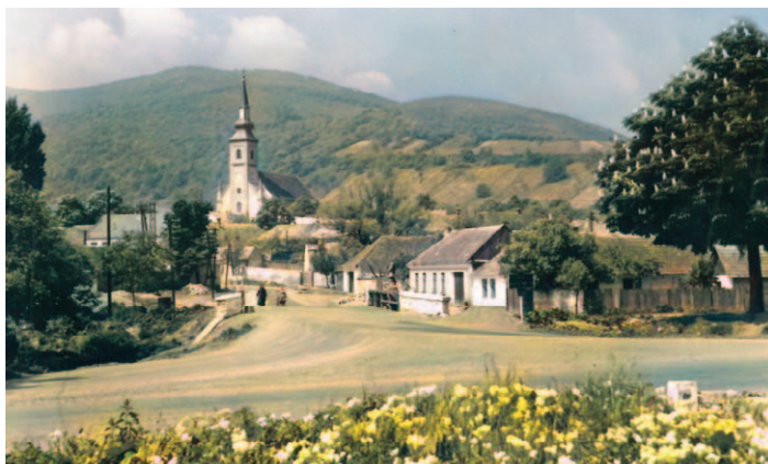
Pohľad na Lázeň, kolorizované