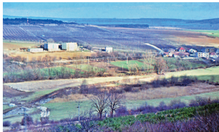
Pohľad na Rajčanku, Nivy a Starú cestu počas budovania hrádok 1988.01.08, popredí kaplnka Sv. Františka