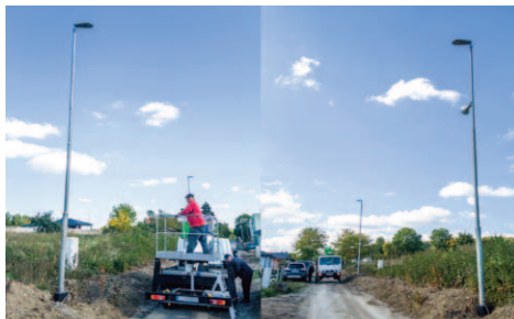
Rozšírenie osvetlenia a rozhlasu