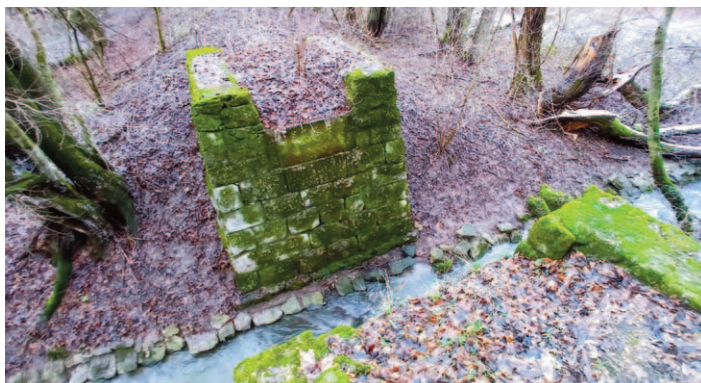
Most na 600 mm trati z roku 1898 spájajúcej fabriku so železničnou stanicou Smolenice

Z vetvy ku Klokoču viedla aj 5 km dlhá odbočka cez dolinu Kamenné mlieko do Vydatej a ďalšia odbočka do doliny Zabité. Ďalšie dve odbočky viedli z „chemiky“ na Rybnikárku a na pílu. Mnohé odbočky na trase s dĺžkou 2 – 5 km boli len dočasné, pokým sa nevyťažilo drevo. Samostatná trať bola pod vrchom Komperek (dnes Kříč). Drevo sa ňou dopravovalo šmykom a ďalej sa spúšťalo k ceste powyše vápenky.