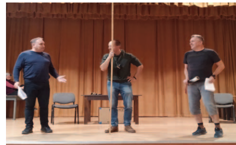
Muzika bez muziky