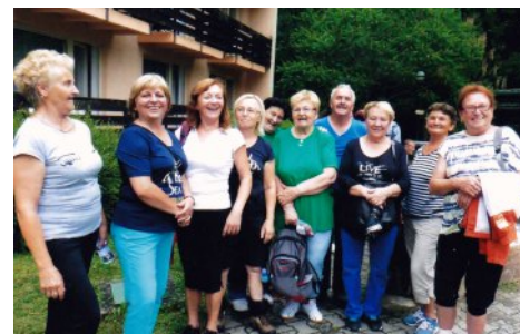
I keď sme starí, sme ešte jarí Na strane 1, 2