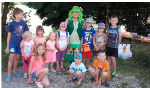
Cesta k vodníkovi Horné Orešany 2016 Na strane 1