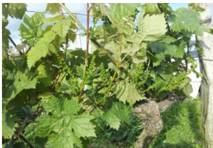
Správne postrekovanie viniča Na strane 5