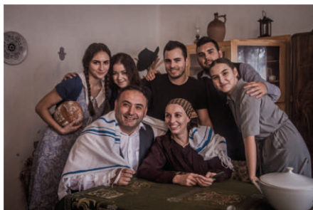
FidliCanti filmovali Uličku