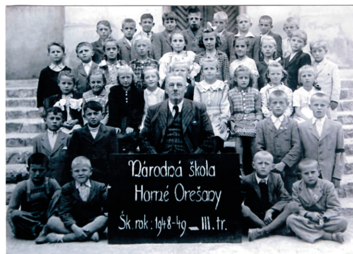
Národná škola Horné Orešany, dnes 80-tnici, archív Viera Šimončíčová