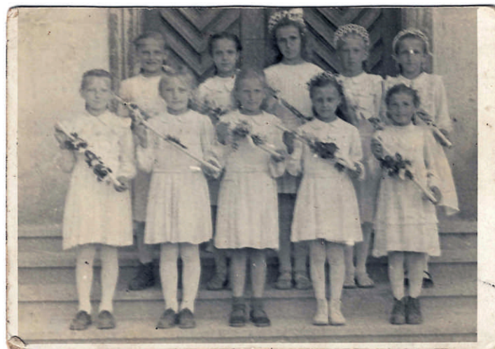
1 sv. prijímanie, dnes 80-tnici, archív Viera Šimončíčová