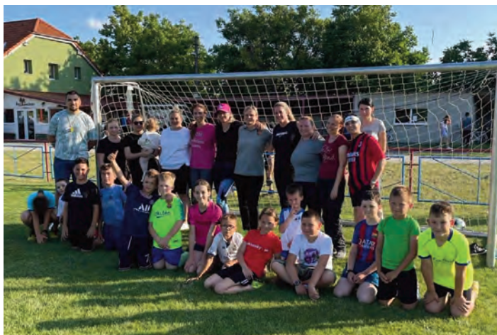
Ukončenie, posledný zápas sezóny mamičky vs. deti – kategória U 11

teraz organizujeme nábor detí do všetkých mládežníckych kategórií, ale nie je problém pridať sa kedykoľvek. Všetkým fanúšikom, priaznivcom, hráčom a rodičom detí ďakujeme za podporu a tešíme sa na novú sezónu 2022/2023, ktorá štartuje už prvý augustový víkend. Rada klubu TJ