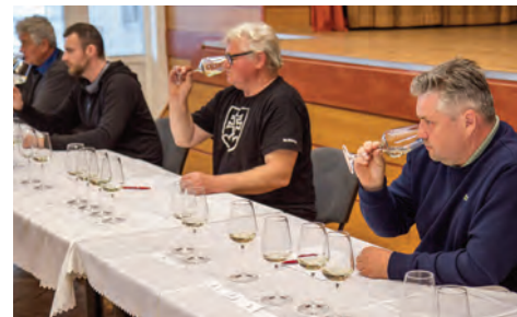
Orešanská košťofka 2022