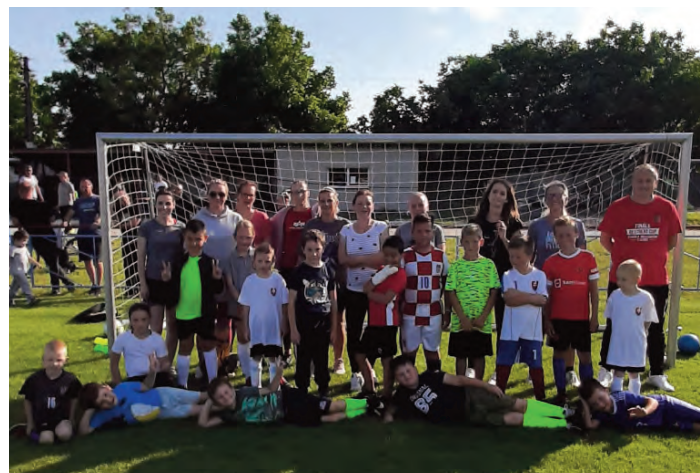
Ukončenie, posledný zápas sezóny mamičky vs. deti – kategória U 9