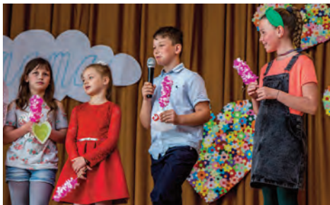
Kultúrne podujatia v obci - Deň matiek