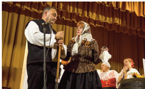
Rínek opäť privítal svojich priaznivcov