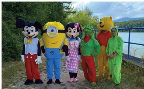
Cesta k vodníkov