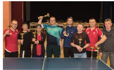
O.Z. Betonári - stolný tenis